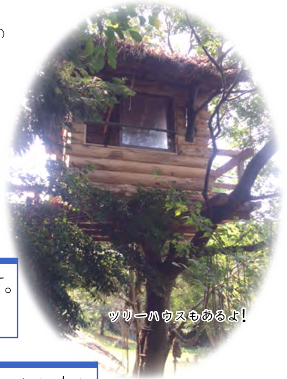
ツリーハウスもあるよ!

環境 山の中腹にありますので、周囲には木々と土と空と風とでっかい虫…。建物も木造の体に優しい空間。