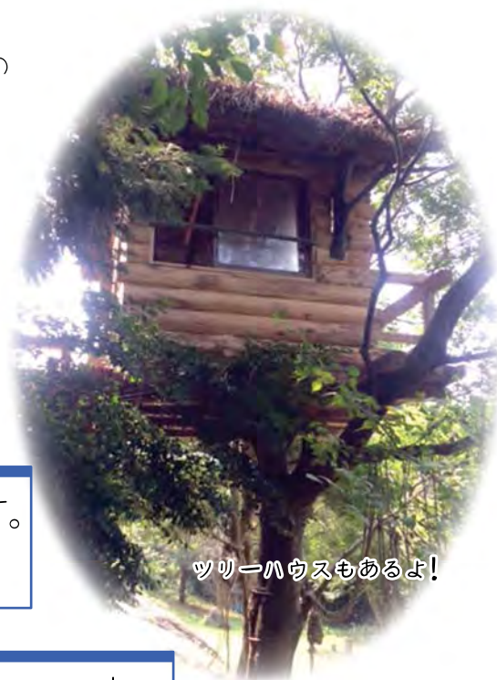
ツリーハウスもあるよ!

環境 山の中腹にありますので、周囲には木々と土と空と風とでっかい虫…。建物も木造の体に優しい空間。